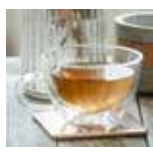
70°C Tè Bianco