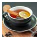
60°C Tè Aromatizzato