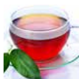
95-100°C Tè Nero