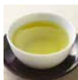
80°C Tè Verde