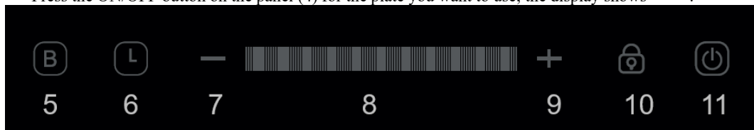
Control panel (4)