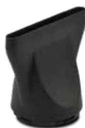
Concentratore Styler per lisci perfetti