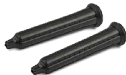
Coni Wave-Design per bellissime onde