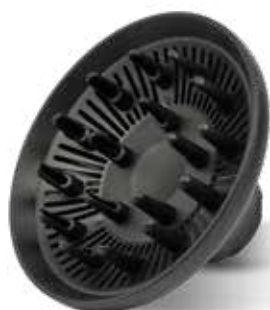
Diffusore per asciugare capelli ricci e mossi

Monna Lisa include 3 accessori specifici per ogni tipo di capelli: diffusore per capelli ricci e mossi, concentratore Styler per lisci perfetti, 2 coni Wave-Design per creare magnifiche onde. Dotato di controllo digitale e cavo extra lungo assicura la massima praticità nell'utilizzo.